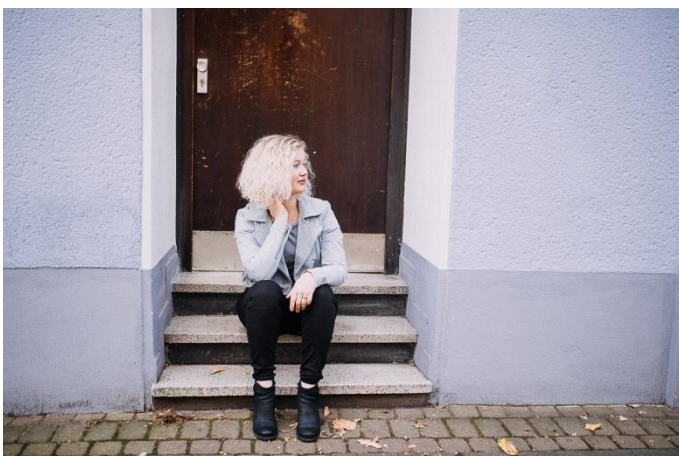
Singer Songwriterin Fina & Band

Mit schwerelosen Melodien und sanfter, klarer Stimme macht Nikola Materne aus Alltäglichkeiten berausende Songs, denen man sich nur schwer entziehen kann. Selbst mit vielen eigenen Programmen unterwegs, begleitet Münsters beliebte Sängerin in bewährter Konstellation das Jazz Lounge Trio.